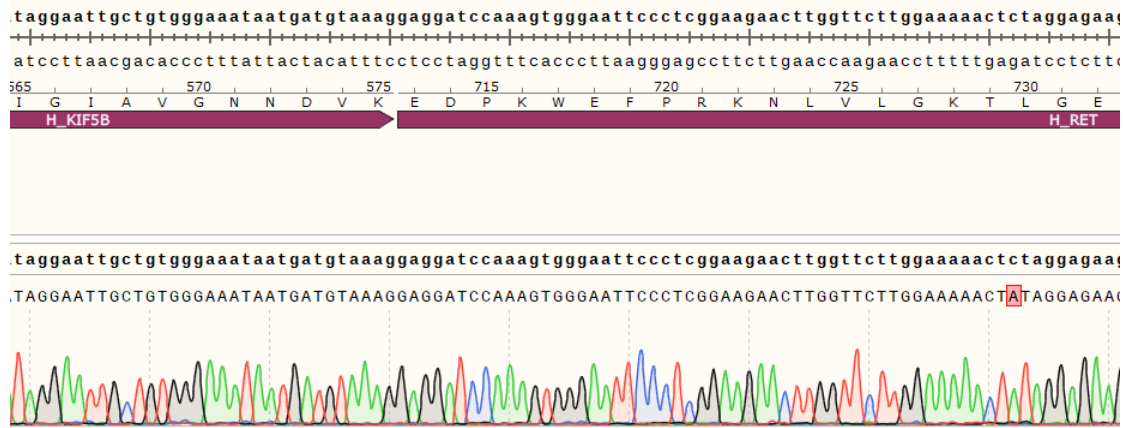
Fig 2. Sanger 测序结果